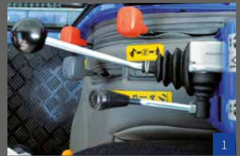
Die Joystick-Kommandozentrale zur kompletten Hydrauliksteuerung.