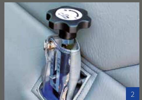
Schnitthöhen-Einstellung des Mähwerks innen in der Kabine.

Optional können Ölmotorenantriebe am Traktor vorn und hinten betrieben werden. Die Ölmenge kann stufenlos vom Fahrersitz geregelt werden.